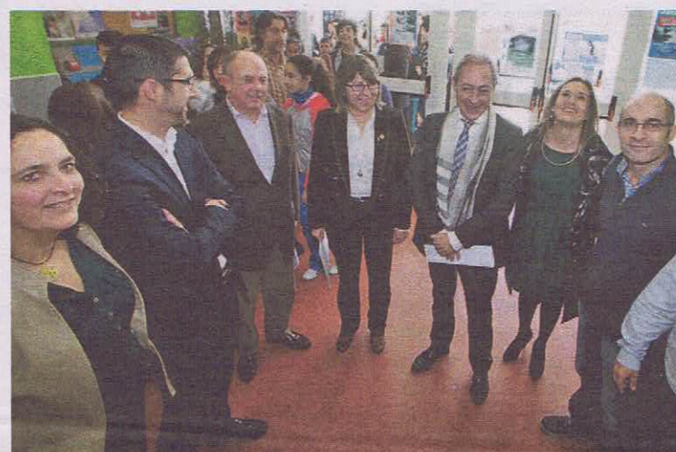
Las autoridades, a su llegada al instituto sonense. MARCOS CREO

Por su parte, el presidente de Confemadera explicó que tanto las unidades didácticas que se presentaron como el concurso, que está abierto a participantes de toda Galicia, buscan cubrir las «carencias» detectadas en los libros de texto sobre los re-